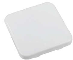
1x EIN/AUS RTS32-ACC-01-xxP