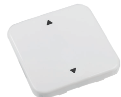
1x AUF/ZU RTS32-ACC-02-xxP