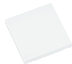
RTS34-ACC-01-xxP 1x EIN/AUS